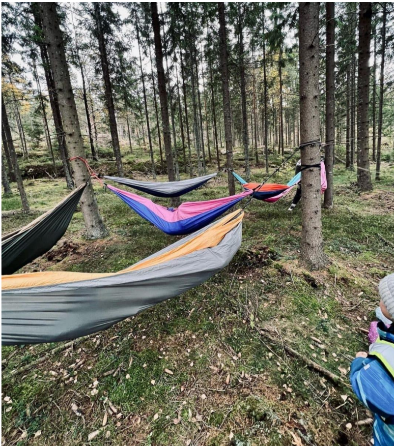
Figur 3 på tur med hengekøyer