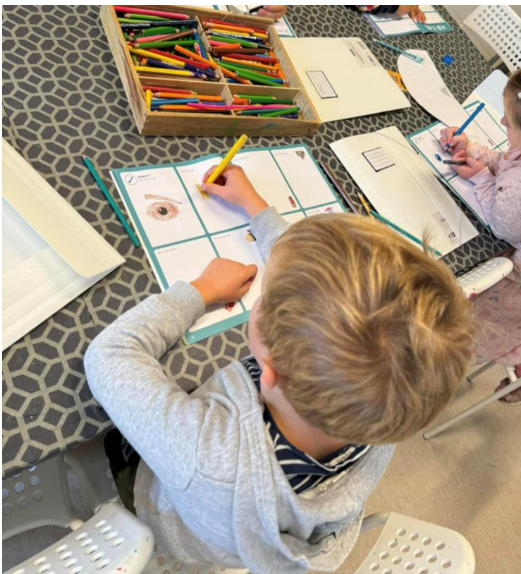
Figur 5 stor stas med femårsklubb!

Barnehagen følger kommunens rutine for overgang mellom barnehage og skole/ SFO for å sikre barna en god og trygg overgang. Dette innebærer er felles arbeid med skolestarterne i barnehagen og dialog og utveksling av informasjon mellom barnehagene og skolene, samt foresatte. Vi legger til rette for et eget møte, i forbindelse med foreldremøtet på høsten, for foresatte til barn som skal begynne på skolen.