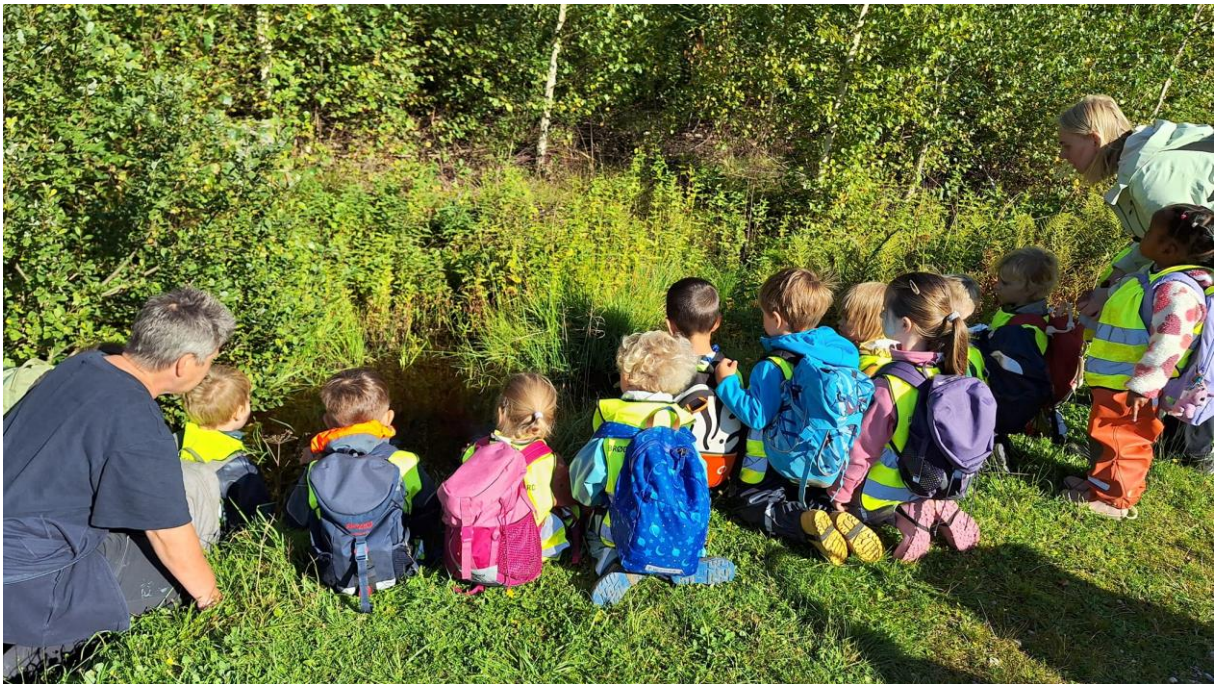
Figur 1 Finner vi noen rumpetroll, mon tro?

Vi har kort vei til skogen som er verdens flotteste lekeplass!