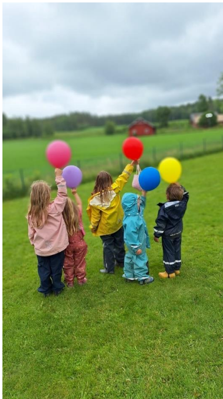
Figur 2 Fargefest i barnehagen, juni 2023