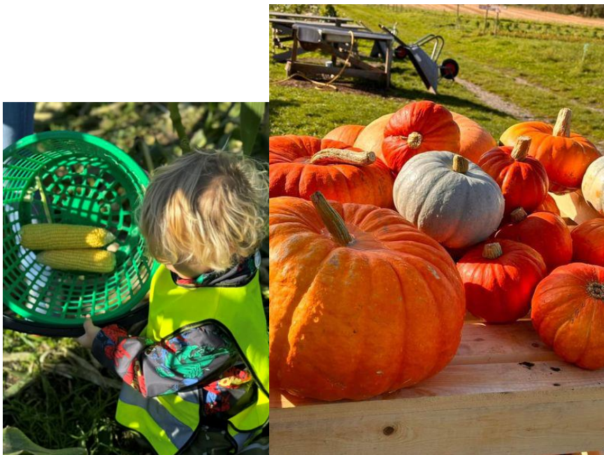
Figur 4 besøk til Skauen gård, september 2023

Vi leverer ut samtykkeskjema for bilder/ video ved oppstart, og bruker den lukkede facebookgruppa vår til å legge ut bilder fra barnehagehverdagen. På vår åpne facebookside deler vi informasjon, samt bilder der ansikt ikke er vist. Vi ber dere melde fra om det er endringer knyttet til fotografering eller deling av bilder av deres barn. Linda, som er ansatt hos oss, tar portrettbilder av barna hvert år.