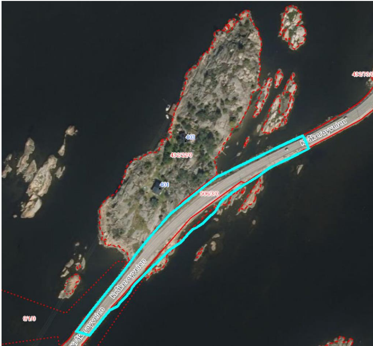
Figur 3 Ortofoto (2015) med planavgrensning, utklippsdato 06.10.17

Den tidligere bomstasjonen på Bukkholmen ble fjernet i 2009.