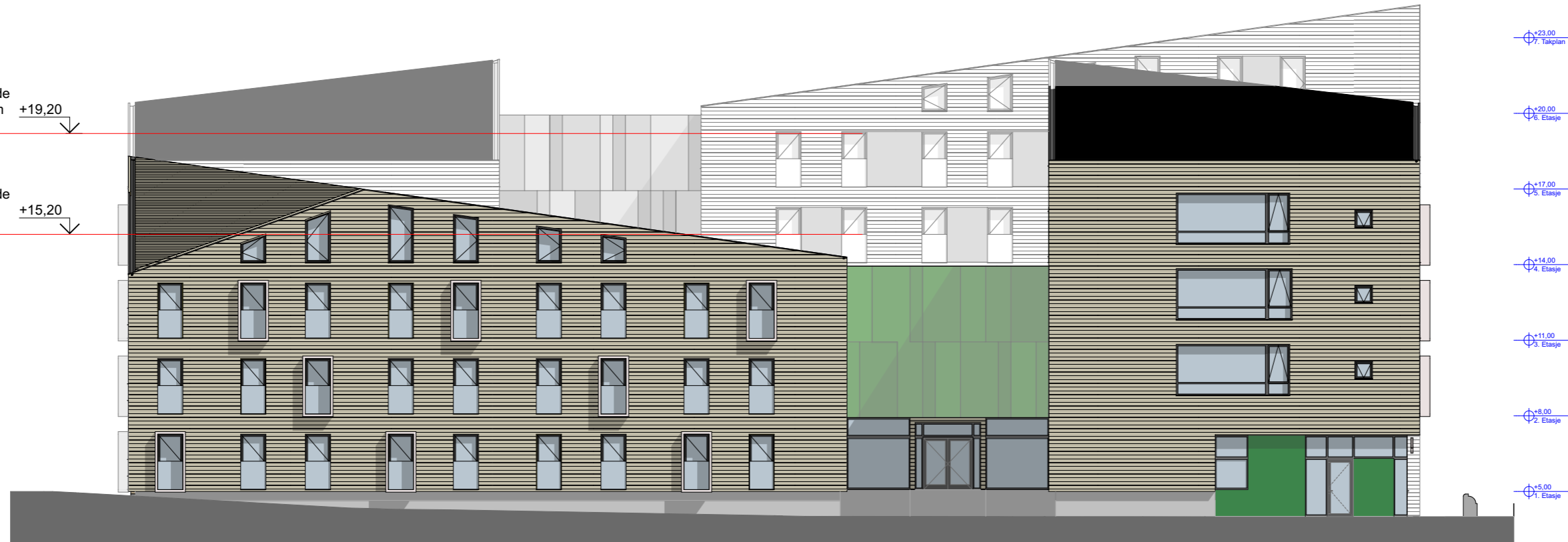
Fasade Sørøst (mot Bjølstadveien)

Maks tillatt høyde for hovedvolum +15,20