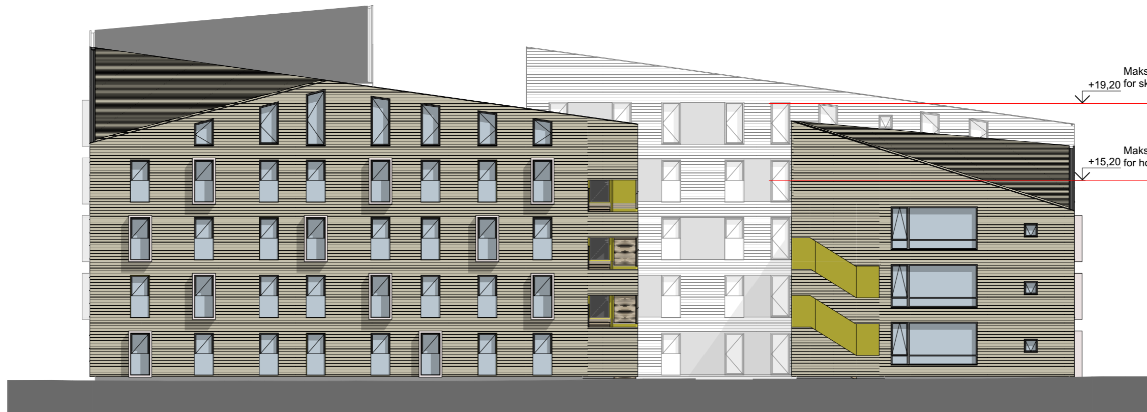
Fasade Sørvest (mot Vennelystveien)

Maks tillatt høyde +15,20 for hovedvolum