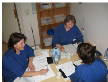
Medlemmene i Start-prosjektet i ivrig arbeid.